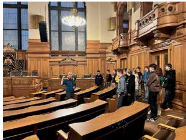
Eine Jugendweihegruppe im Sitzungssaal des Hamburger Rathauses ...

Jugendweihe bedeutet nicht nur Feier. Aber sie bedeutet auch nicht nur Belehrung. Jugendarbeit darf Freude machen – und sie darf herausfordern.