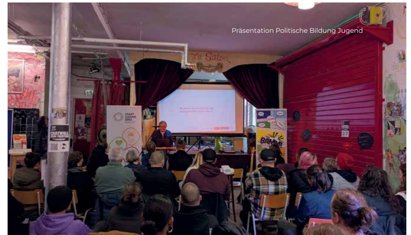
Präsentation Politische Bildung Jugend

An der zweiten Station ging es darum, sich eine eigene Meinung zu bilden, sich zu entscheiden und schließlich abzustimmen. Man konnte mit verschiedenen Dingen zu unterschiedlichen Fragen abstimmen. Zum Beispiel: „Werden Kinder vom Internet nicht zu stark und vielleicht falsch politisch beeinflusst?“ Die Gegenstände, mit denen man abstimmen konnte, waren z.B. Bälle in eine Röhre stecken, Muttern eine Schraube herunterdrehen lassen oder mit Legos bauen. Das war ziemlich interessant, weil man sehen konnte, wie die anderen abgestimmt haben. Wiederum musste man aufpassen, sich davon nicht beeinflussen zu lassen, sondern bei seiner eigenen Meinung zu bleiben.