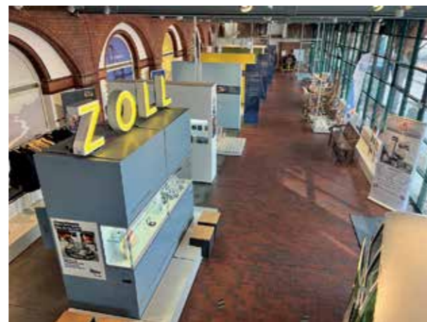
Das Deutsche Zollmuseum in der Hamburger Speicherstadt.