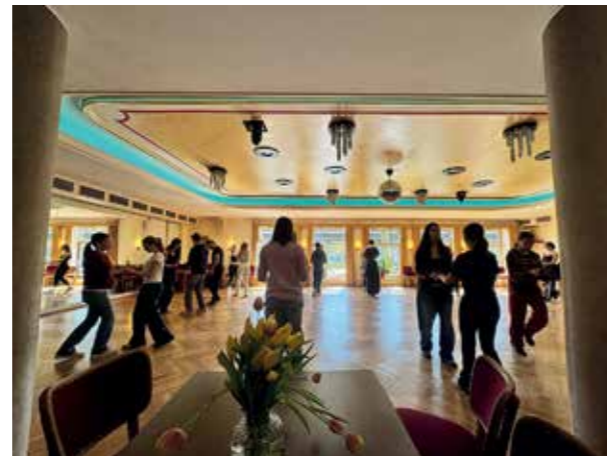
... und bei Tanzschule Bartel, um einige Grundschritte des Tanzens zu lernen.