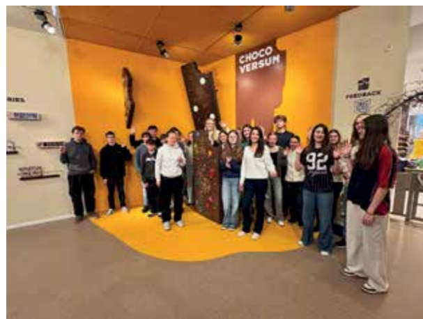
Im Chocoversum in Hamburg, um den Weg von der Kakaofrucht bis zur Schokolade zu verfolgen.