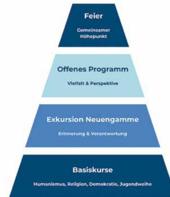
Schaubild zum Aufbau unserer Saison

Als vergleichsweise kleiner Landesverband haben wir die Möglichkeit, sehr intensiv zu arbeiten. Diese Chance nutzen wir bewusst. Unsere Saison basiert auf drei Bausteinen: